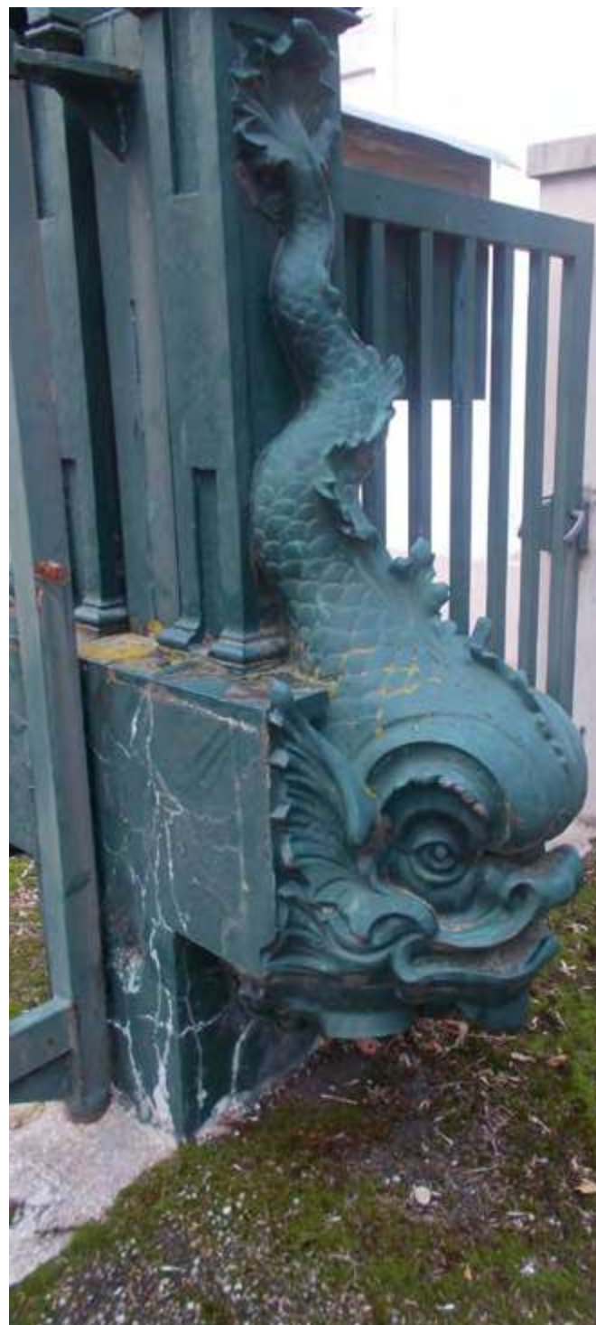
Entrée de l'usine

Démontés en décembre 2020 ils ont été restaurés et ornent de nouveau l'entrée du magasin et des bureaux administratifs de la nouvelle usine située à Saint-Jean-De-Moirans