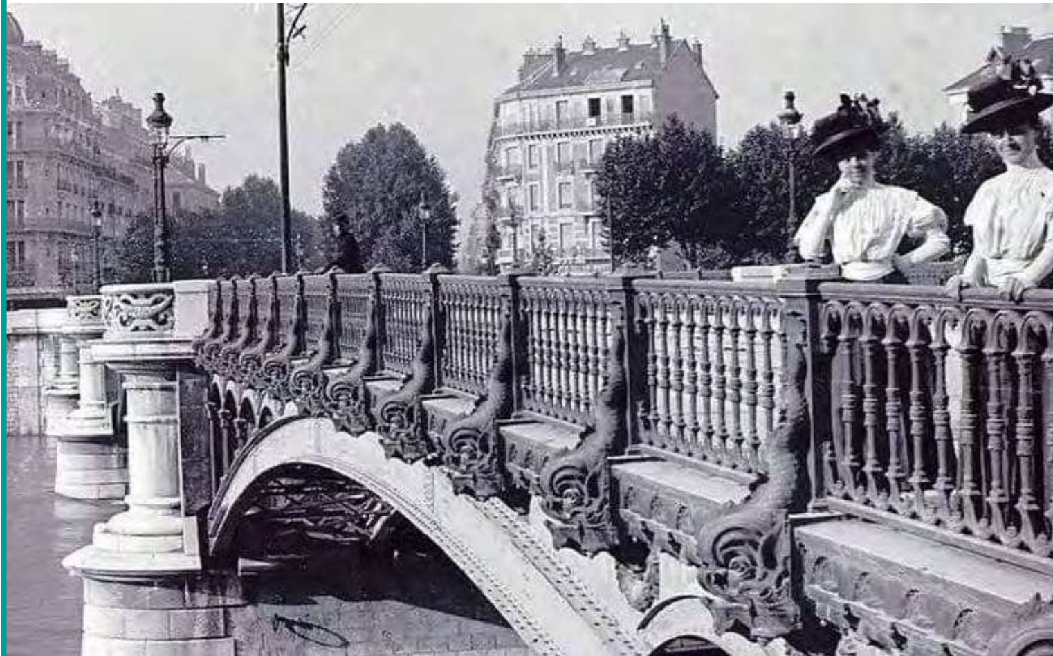
Le pont de Porte de France

C'est en 1887, que le Conseil Municipal de Grenoble vote la réalisation de ce pont sur l'Isère. Il sera métallique car le métal présente bien des avantages à cette époque, il portera le nom de "Pont de la Porte de France". Douze entreprises ont répondu à la soumission et c'est l'entreprise de Gustave Eiffel (1832-1923) qui est retenue car ses constructions sont renommées : la gare de Budapest (1875), le viaduc de Garabit (1880) et la tour Eiffel en 1889. Le pont aura deux voies de circulation avec le passage du tramway vers Saint-Egrève et sera formé de trois arcs identiques, les gardes-corps seront garnis de 72 balustres en fer fonte pesant chacune 410 kg représentant un dauphin, symbole du Dauphiné. La représentation des dauphins remonte à l'antiquité. Ce sont les dauphins mythologiques de Neptune, comme on peut les voir sur une mosaïque d'Ostie, l'antique port de Rome. Pour éclairer le pont, huit candélabres garnis de lanternes sont prévus aux entrées du pont et sur les piles.