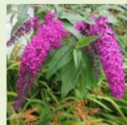
Arbre à papillon ou buddleia