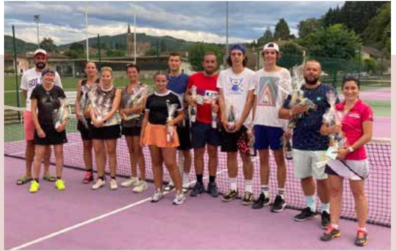
Finalistes du tournoi de double

Tournoi interne conjointement avec le TCGL et le TC Virieu de Novembre à Mars