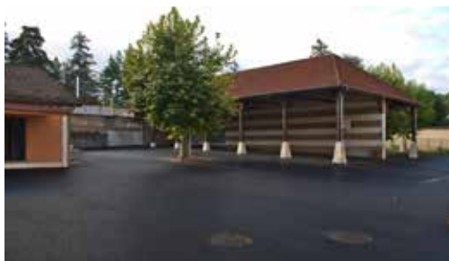
Rénovation des bâtiments et de la cour de l'école élémentaire.