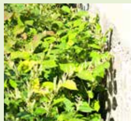
Renouée du japon