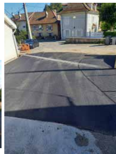
Rue Sully - travaux pour collecte des eaux de ruissellement