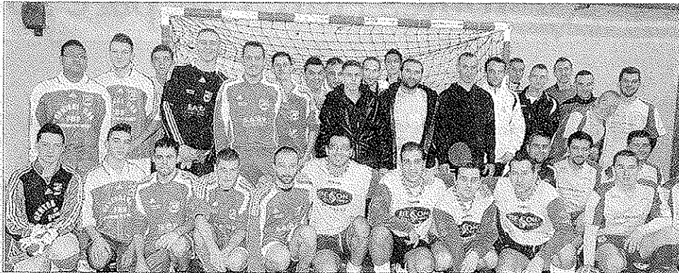
Les équipes seniors.

Profitant d'un championnat encore dans sa phase de trêve, l'Étoile sportive Izeaux organisait ce week-end quatre tournois de football.