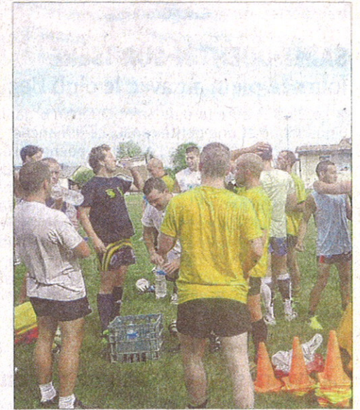
Un bac d'eau à 4 degrés pour réparer les muscles échauffés par les efforts fournis plus tôt dans la journée.