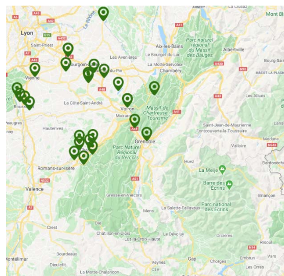
Carte : Nids confirmés de frelon asiatique sur le département de l'Isère en 2019

Les conditions climatiques de l'année semblent avoir été défavorables au prédateur. Malgré tout, le frelon asiatique continue sa progression.