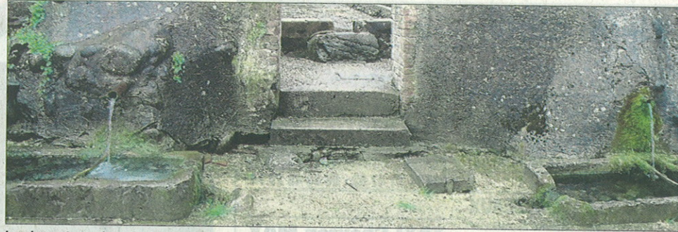
La place et ses deux fontaines.

Cette petite place où se trouvent l'ancien lavoir et ses deux fontaines restaurées en 1840, a toujours été le coin privilégié des rassemblements de jeunes. Dans les