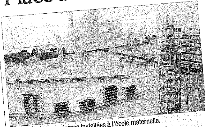
Les constructions géantes installées à l'école maternelle.

Un animateur du centre Kapla de Lyon est venu dernièrement installer ses constructions géantes dans les locaux de l'école maternelle. Les enfants ont ainsi pu apprendre les secrets de ces constructions avec des milliers de petits morceaux de bois naturels ou de couleur qui, empilés les uns sur les autres, forment des tours en équilibre, des bateaux, des trains. Après le temps de la construction, est venu le moment de la démolition. □