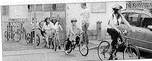
Les plus jeunes ont fermé la marche.

■ Après des semaines d'entraînement dans les allées du parc, puis sur les routes du village, les élèves de CE1-CE2 et CE2-CM1, accompagnés de leurs institutrices Mmes Chiesi et Adigery, ainsi que de quelques parents, se sont élançés dernièrement pour une sortie vélo direction les étangs de Saint-Etienne-de-Saint-Geoirs. Ils ont effectué les quelque 15 kilomètres aller-retour avec enthousiasme, prouvant ainsi qu'ils ont su mettre à profit les cours de sécurité routière dispensés durant l'année scolaire.