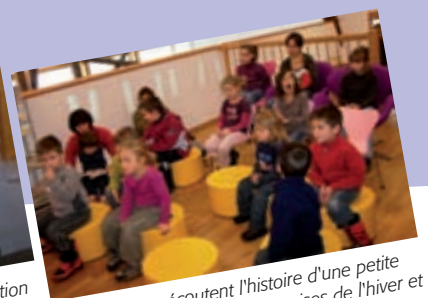
Les enfants écoutent l'histoire d'une petite souris qui découvre les surprises de l'hiver et les joies de Noël.