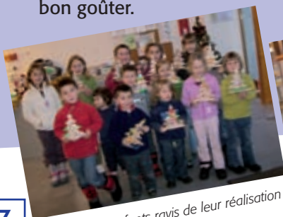
Des enfants ravis de leur réalisation