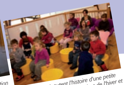
Les enfants écoutent l'histoire d'une petite souris qui découvre les surprises de l'hiver et les joies de Noël.