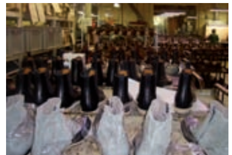
Lors de la visite

A chaque parution du journal « Izeaux Infos », la municipalité aimerait rencontrer une entreprise de la commune et ainsi mieux la faire connaître aux Uzelots. Aussi, nous débuterons cette rubrique par l'entreprise Richard-Ponvert, fleuron de la chaussure, qui fête cette année 2008, son centenaire.