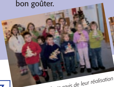
Des enfants ravis de leur réalisation